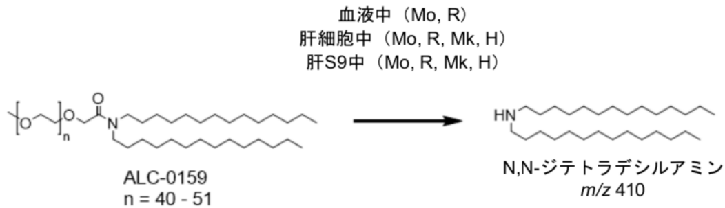
Figure 4 種々の動物種での ALC-0159 の推定生体内代謝経路